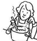
tehdä ruokaa (2)