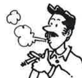
polttaa tupakkaa (1)