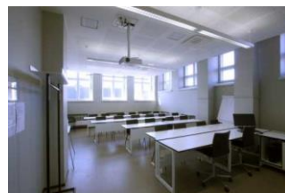
sali / luentosali